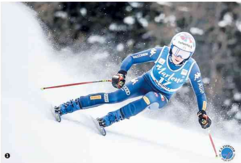
1. Marta Bassino nel Super G di Coppa del mondo a La Thuile, quinta. 2. La fuoriclasse Mikaela Shiffrin (prima nel Super G di Bansko, con Lara Gut terza e Bassino seconda) in una diretta social ha rivolto molti complimenti a super Marta. 3. Il trionfale ritorno a Borgo San Dalmazzo lo scorso 2 dicembre dopo lo storico primo oro in gigante del 30 novembre a Killington, Stati Uniti. 4. Alla festa del Centro sportivo Esercito ad Aosta nell'aprile 2019.